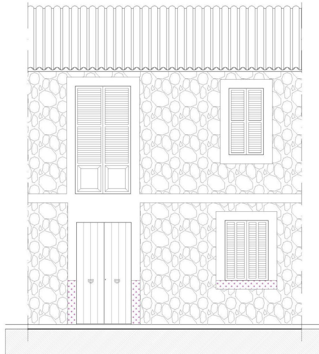
ESTADO REFORMADO - FACHADA PRINCIPAL