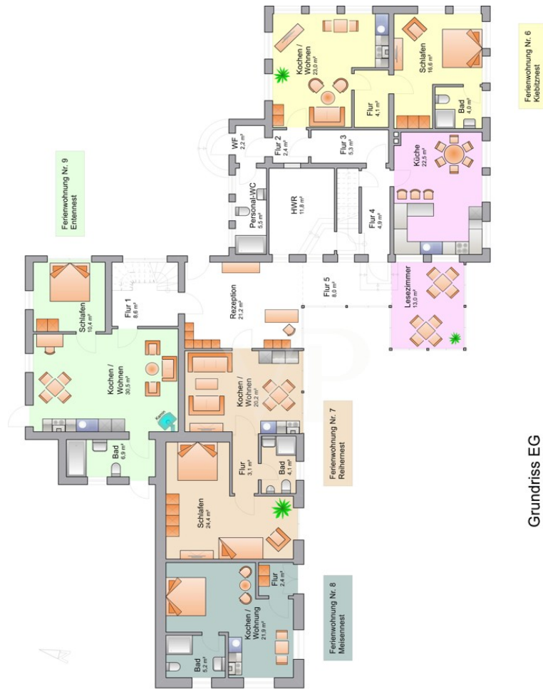
Grundriss EG Hauptgebäude